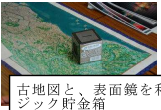
古地図と、表面鏡を利用したマジック貯金箱