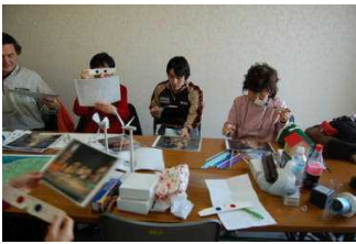
立体メガネを使って立体視

2月例会は、10名の参加でした。ネタの方は、磁石や電気の学習の本質に迫る話や立体視(これがまたすごい)、ストローロケット、古地図、表面鏡、おもしろブックの紹介、ロープマジックのレクチャーなど、時間があっという間に過ぎてしまいました。