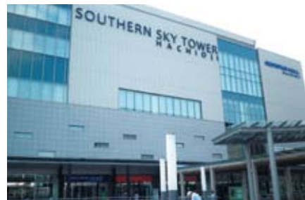
八王子オリンパスホール外観