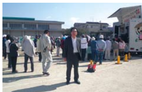
山田小校区自主防災会訓練の様様

9月23日の「敬老と中宮の集い」をはじめ、10月7日の「中宮小校区区民体育祭・桜ヶ丘北校区スポーツフェスタ」や、10月21日の「山田小校区自主防災会訓練」11月4日の「中宮小校区自主防災会訓練」など、多くの秋の地域行事に参加させていただきました。