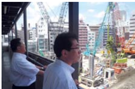
豊島区新庁舎整備工事中見学

新たな借金をせず整備を図る、豊島区新庁舎建設計画の現地視察と、住宅店舗など官民共同で整備を図った「オリンパスホール八王子(八王子市民会館)」を訪問視察しました。枚方市においても、老朽化した現市民会館と庁舎の今後の整備について、効率的な観点で検討しなければなりません。