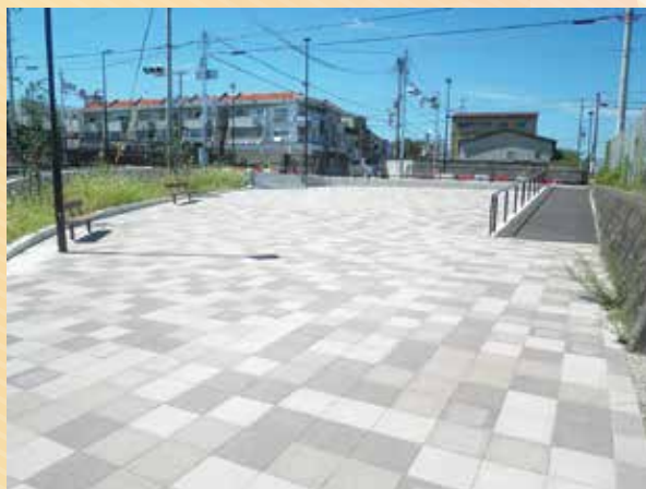
交差点隣接のポケットパーク