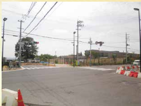
改良された交差点

前号でお知らせしておりました、中宮地域精神医療センター東側「宮之阪3東」交差点の改良工事が完了しました。私は形状がいびつで危険な交差点解消の為の要望書を、地元校区コミュニティー協議会の皆さんと市当局に提出しておりました。また交差点隣接松丘町内に公園が無く、地元住民の憩いの場整備を、地元自治会と共に市当局に要望書提出を行う中、交差点改良に合わせポケットパークが整備されました。