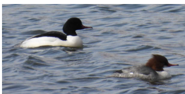
♂ カワアイサ ♀