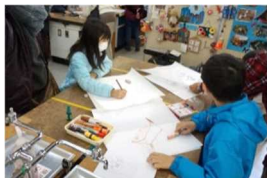
和紙に絵を描いている

はじめにお正月の遊びと、凧と羽子板のいわれについての話を聞きました。凧作りと羽子板作りに分かれ、スタッフや大人の