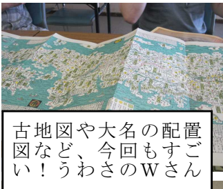
古地図や大名の配置図など、今回もすごい！うわさのWさん

7月例会は、学期末ということもあって、4名の参加でした。内容的には、多彩な出し物がもちよられ、惜しいことをしました。夏の全国大会(宇都宮大会)には、サークルのメンバー、8名と一緒に参加しました。あと数名が個別に参加していました。科学お楽しみ広場は、すごい熱気でした。夜のナイターは、今年も二日間にわたり、チームを分けて担当しました。夕食は、みんなで餃子を食べに行きました。宇都宮の餃子は、種類が多く、おいしかったです。大会の合間を縫って、日光と大谷石の産地の見学に行きました。震災の影響で、大谷石の洞窟は、閉鎖されていました。