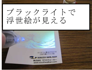
ブラックライトで浮世絵が見える