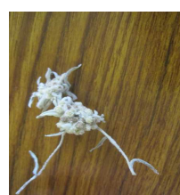
自宅で栽培した「エーデルワイス」をドライフラワーにしました。