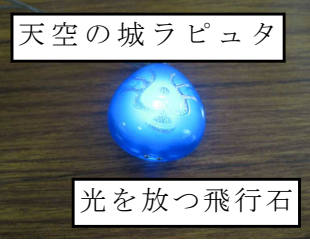
天空の城ラピュタ