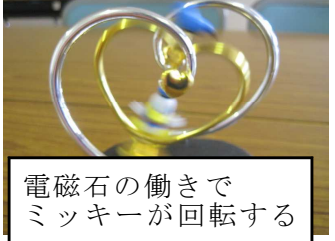
電磁石の働きでミッキーが回転する