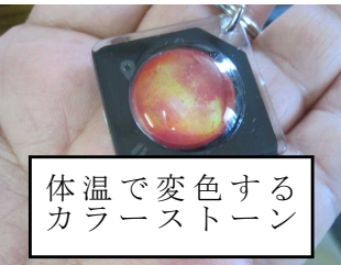
体温で変色するカラーストーン